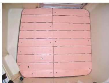
スノコちょうせい君 設置後