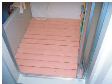
スノコちょうせい君 設置後