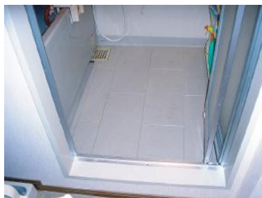
スノコちょうせい君 設置前