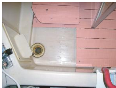
ユニットバス 排水分割型